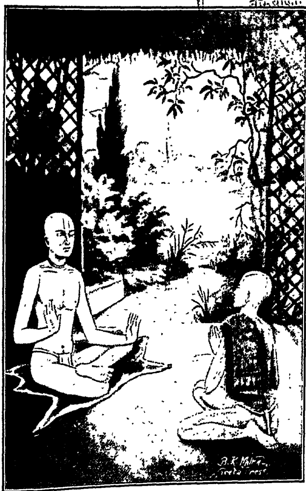
सनातन और चैतन्य